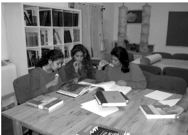
פעילות נוער במרכז למידה

כרגע פועלים במושב מספר חוגים: חוגי טבע, כדורגל, ג'יוג'יסטו, מחול ותכשיטנות. החוגים מועברים ע"י מורים מקצועיים ומנוסים ובמחירים מפתיעים, פרטים נוספים במזכירות הועד המקומי או אצל הענ"קית.