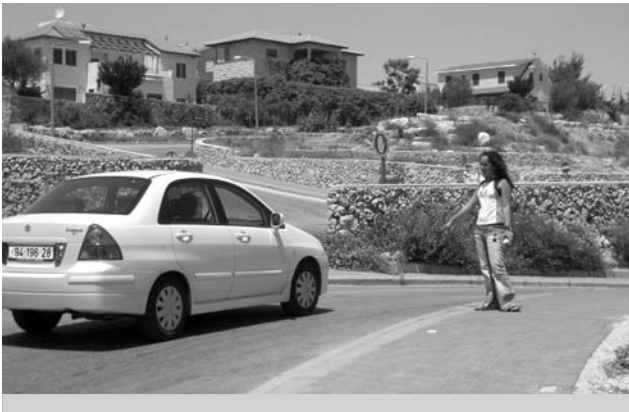
יעצור?... לא יעצור?