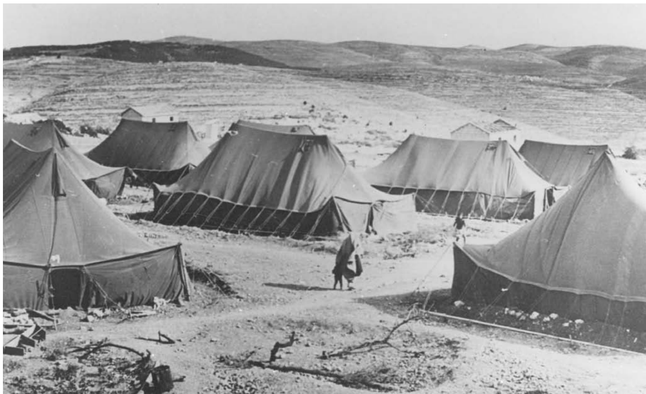
הבעת יערים - נובמבר 1950: מאהל המהגורים ולצידו בתים ראשונים. ברקע: מעלה החמישה - נבי סמואל