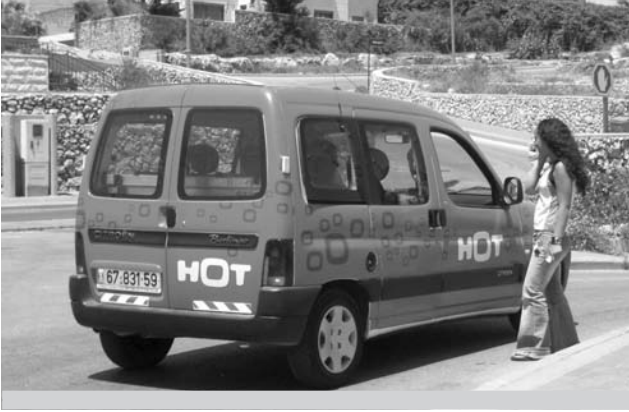
לא! הוא מהיע לשום מקום!