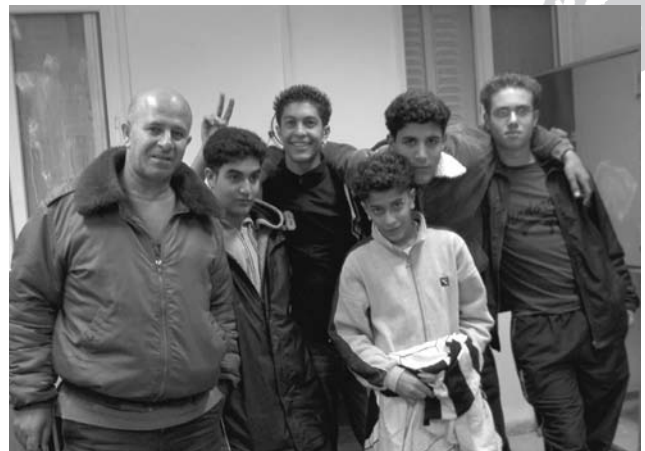
פעילות נוער במועדון בוגרים

בני נוער בכיתות ט'-יב' מוזמנים להכיר עולם אחר... נפתחת קבוצה חדשה לכלל המושבים שבאזורנו. אחת לחודשיים נקיים מפגשים וסיורים בנושאים שונים ונתכנן דברים לכלל המושבים.