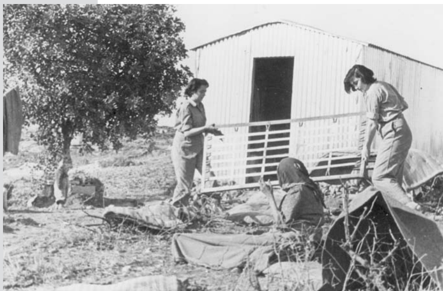
הפחון לאחר האוהל: חיילות מסייעות לקשישה חממה